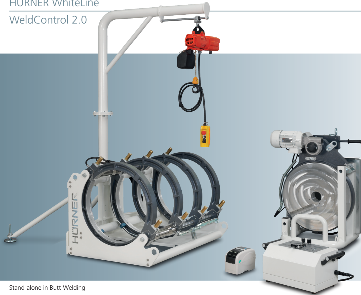
Stand-alone in Butt-Welding