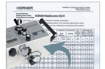
WeldControl Schweißen – ohne Fehler, ohne Schweißtable und mit Protokollierung