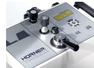
Frontfolie mit GT-Tastatur