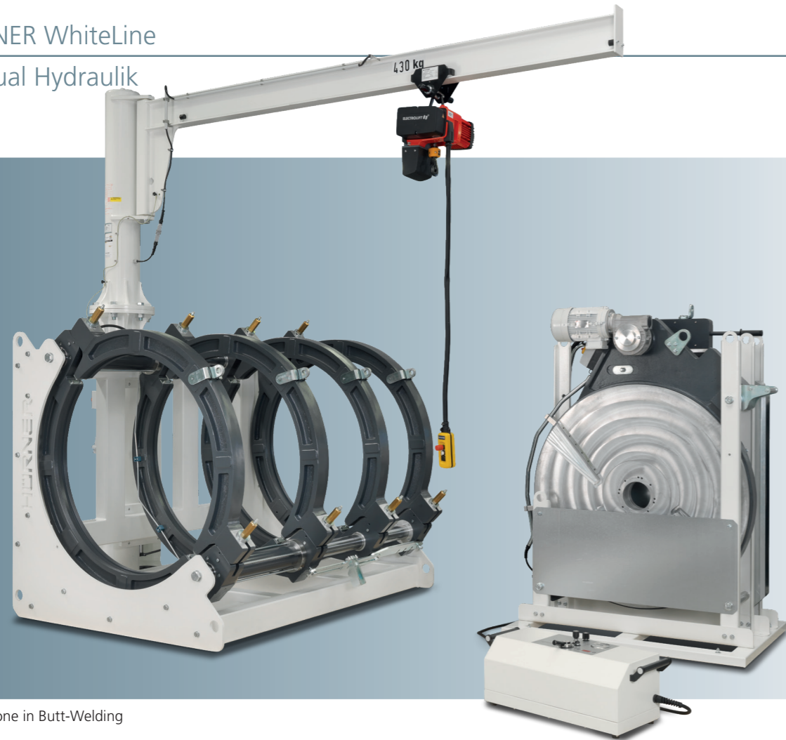
Stand-alone in Butt-Welding