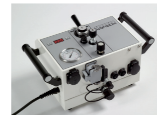
Alle Anschlüsse auf der Gehäuserückseite