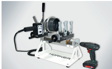
Antriebsmaschine Akku-Schrauber/ Bohrmaschine optional