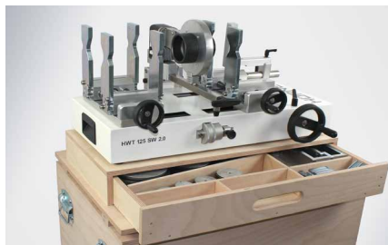
Holz- Transport- und Montagekiste