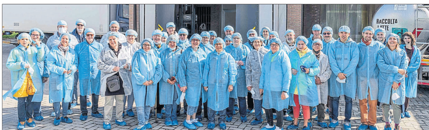
Die Führung in einer Käseerei kam sehr gut an.