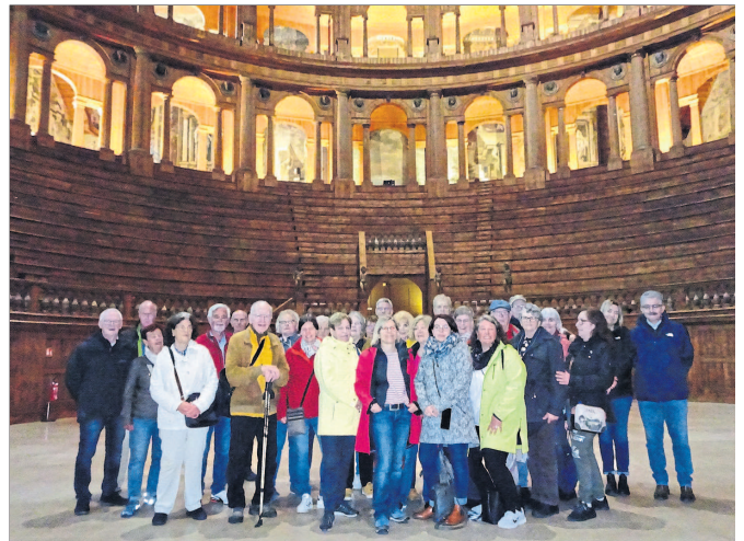
Die Butzbacher Delegation genoss den Besuch im Teatro Farnese.

Danach ging es zur Besichtigung einer Weinkellerei in der Nähe von Collecchio. Der Besitzer des Weinguts, das sich dem biologischen Anbau verschrieben hat, erläuterte ausführlich die Herstellung und die Qualität des Weines. Nach dem gemeinsamen Mittagessen